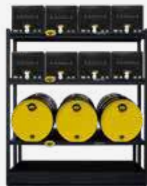
20L | 60L STELLING