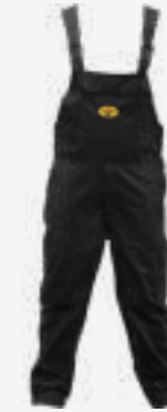
BIB & BRACE OVERALL