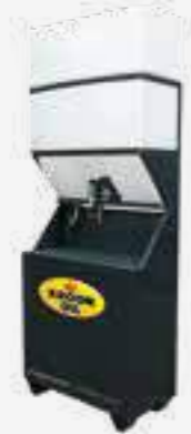
LIQUID STORE 300+