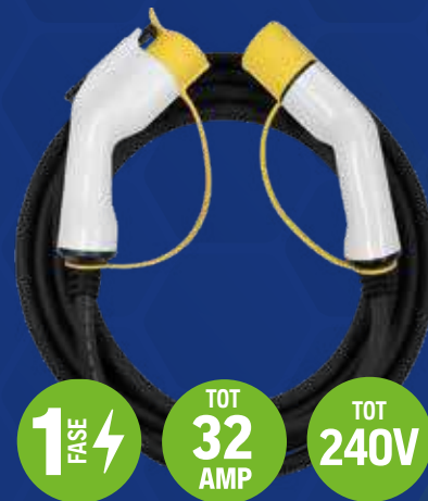
Type 1 naar type 2 stekker NEC102