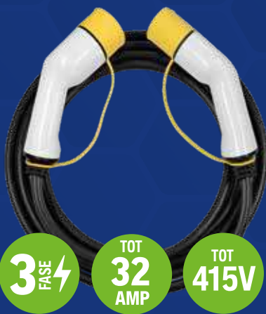
Type 2 naar type 2 stekker NEC101