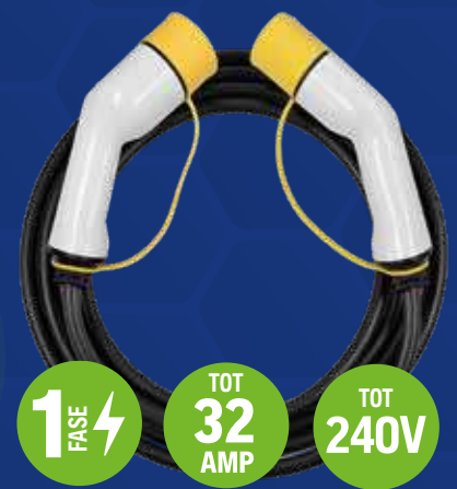
Type 2 naar type 2 stekker NEC107